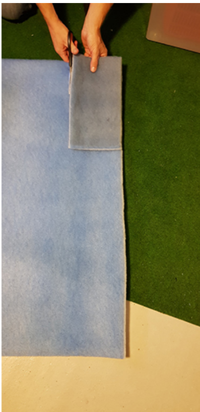
Zuschneiden der neuen Filtermatte

Hier gibt es zum Vergleich 5 m 2 -Rollen G3 (Artikelnr. RW2305) zum Selbstzuschneiden, zu einer Topqualität und sofort ab Lager lieferbar.