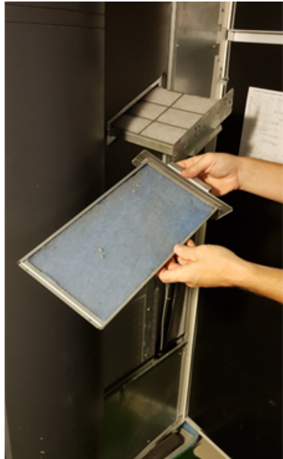
Entfernen der verschmutzten Filtermatte

Nachdem ich im Internet nach einer Alternative gesucht habe, bin ich beim Filtermatten-Shop fündig geworden.